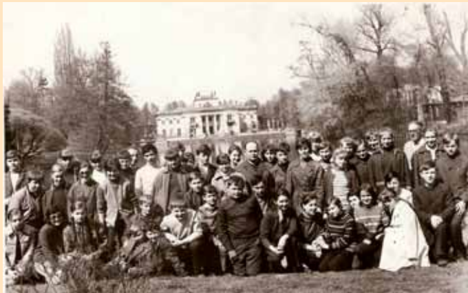
Maj-1971 Wycieczka czl. Spółdzielni Uczniowskiej do Warszawy