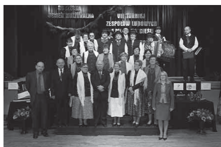
GrandPrix dla Kobiórzan