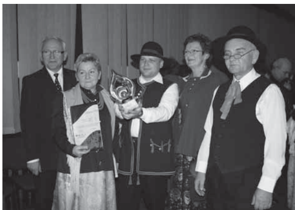
Kobiórzanie w galerii „Na Piętrze” ze statuetką