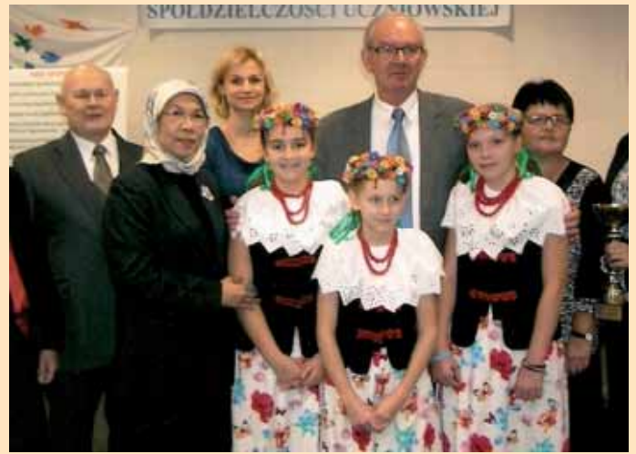
22.10.2010 Delegacja Jutrzenki na Międzynarodowej Konferencji z okazji 110 rocznicy powstania spółdzielni