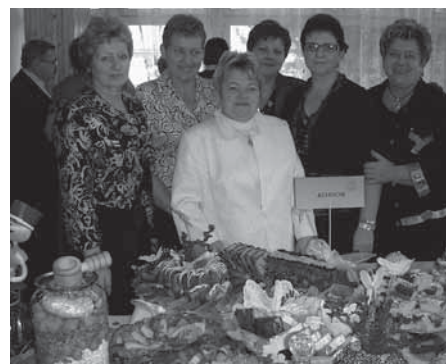
Panie z KGW z przygotowanymi przez siebie potrawami

Spokojnych i wesołych Świąt Bożego Narodzenia życzą wszystkim mieszkańcom Członkinie Koła Gospodyń Wiejskich w Kobiórze