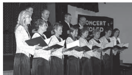
Chór Ex Animo w trakcie ubiegłorocznego koncertu kolęd