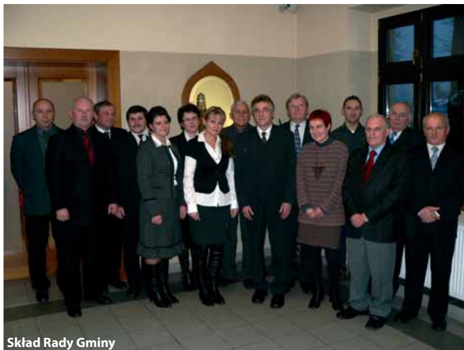
Skład Rady Gminy